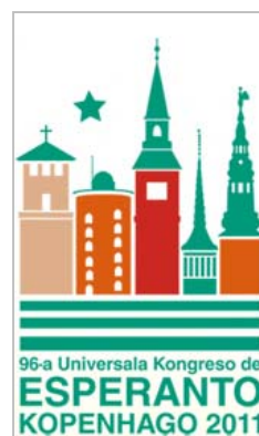
大会シンボルマーク

ウェブページ http://www.uea.org/kongresoj/uk_2011.html