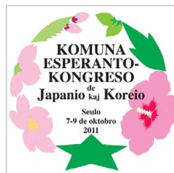
大会シンボルマーク

ホームページ: http://jei.or.jp/evento/2011/kk/indexj.html