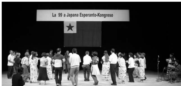
アイヌの伝統舞踏の後に 参加者が舞台上上がり踊りだす

第99回日本エスペラント大会(10月6日～8日、札幌市)が開催され、360人が参加。内訳は、実参加者202、欠席者27、不在参加者131。実参加者のうち、外国からの参加者は26人。盛会のうちに終了しました。