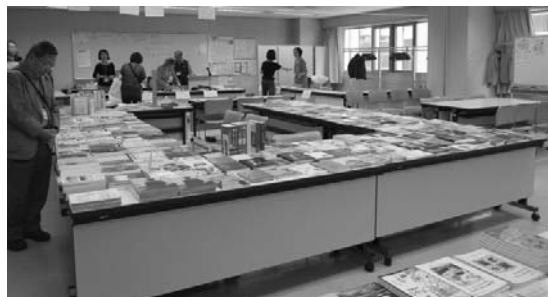
図書販売場で 多数のエスペラントの図書を販売

第100回記念日本エスペラント大会は下記のとおり開催されます。世界のエスペラント運動の中で、100回を迎える大会は初めての事です。日本のエスペラント運動の歴史の厚みを感じます。